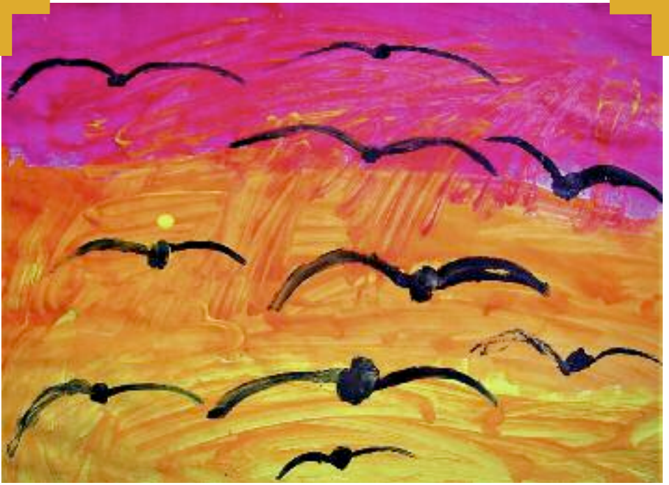
Vögel am Himmel