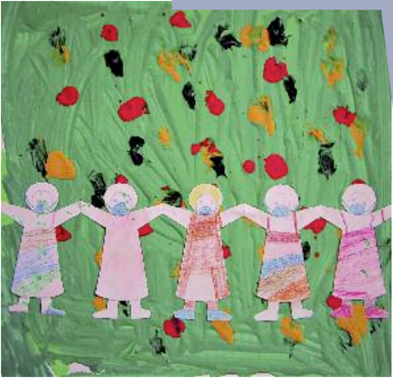
Wir tragen alle Maske