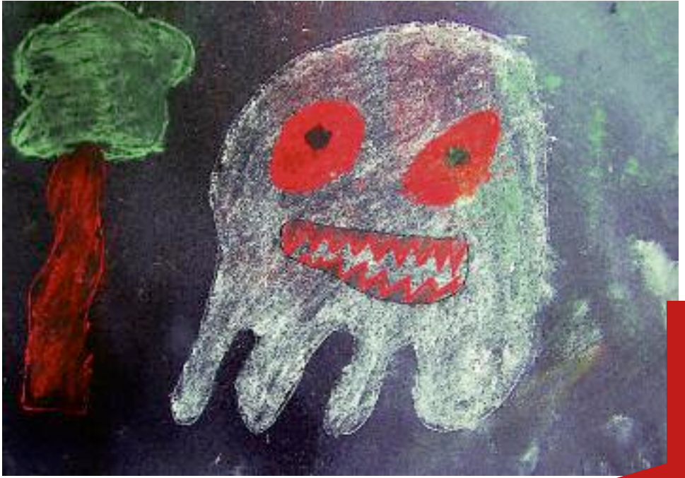
Das Gespenst im Wald